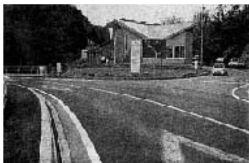
島根県川本土木建築事務所